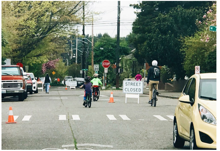
ដើម្បីបន្ថែមអំពីការឆ្លើយតបរបស់ស្ថាន ចំពោះស្ថានភាពផ្សេងៗ បុគ្គលិកបានប្រើប្រព័ន្ធតាមដានត្រួតពិនិត្យបែបឆ្លាតវៃ នៅកន្លែងដែលមានប្រេះស្រាទាំងឡាយ។

ចំណងជើងរូបភាព ស្ទែហែលស្ត្រុត គឺជាគម្រោងរបស់អេសឌីអូធី (SDOT) ដែលបិទផ្លូវក្នុងតំបន់សំរាប់ចរាចរណ៍យានយន្តប៉ុន្តែរក្សាសំរាប់អ្នកធ្វើដើរដើរ, ការលេងរោលីង, និងការជិះកង់លើដំណើរផ្លូវ។